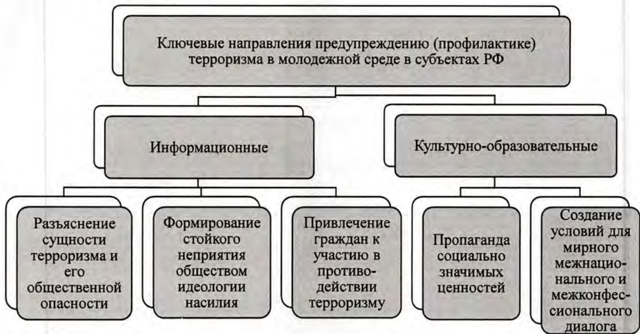
Рисунок 1. Ключевые направления предупреждению (профилактике) терроризма

Перечисленные выше направления реализации Комплексного плана предполагают следующие форматы проведения мероприятий: